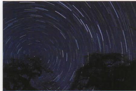
優秀賞「渦巻く星座」