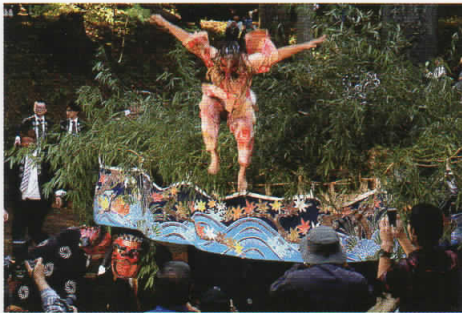
辰野町観光協会長賞「飛んだ天狗」