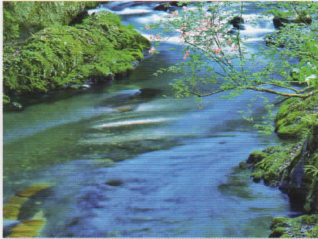
辰野町観光協会長賞「春の横川川」