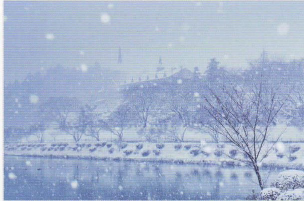
最優秀賞「雪蛍舞うたつの海」