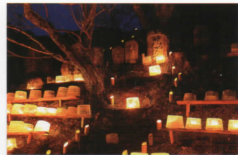
入選「平安のロマンス」