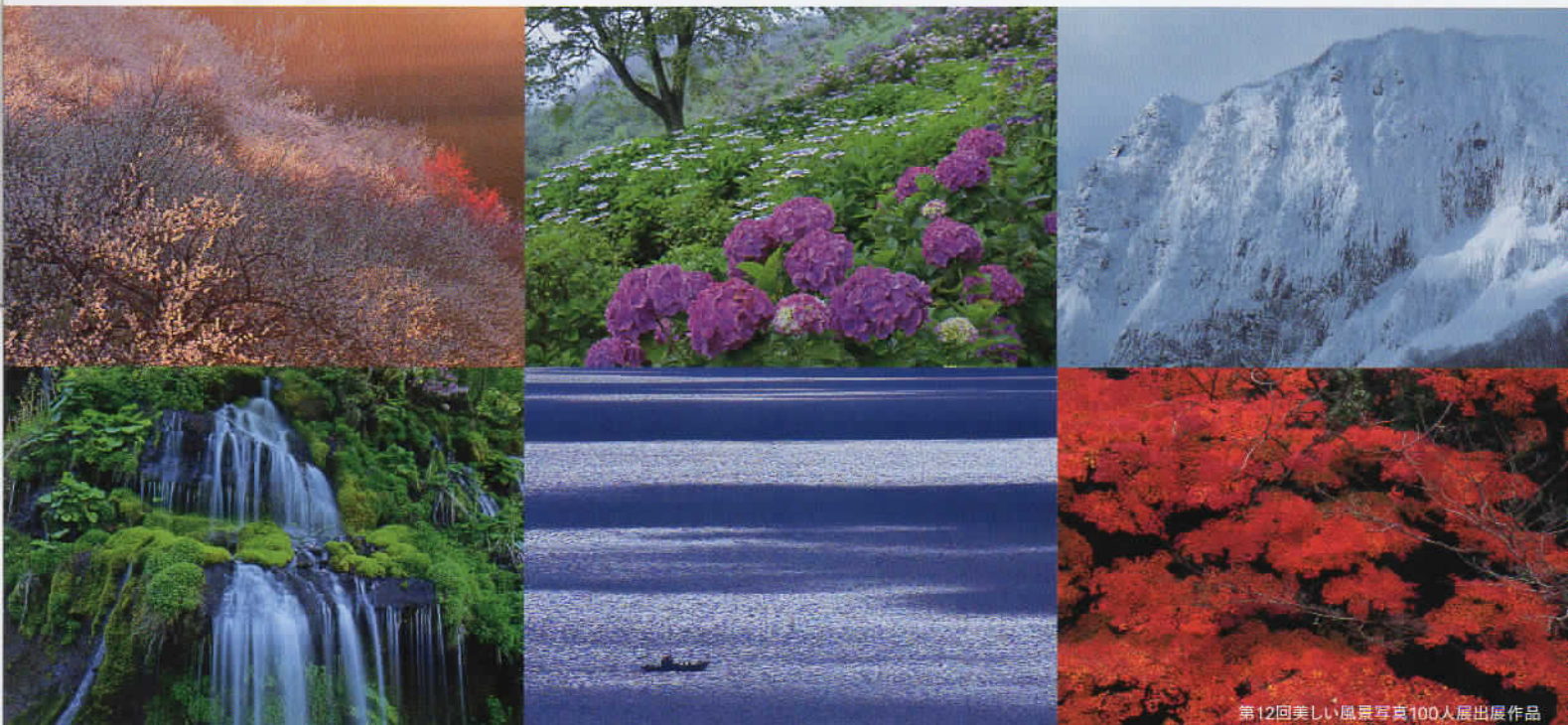
第12回美しい風景写真100人展出展作品