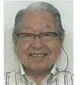
細江 英公 氏 写真家 清里フォトアートミュージアム館長 東京工芸大学名誉教授